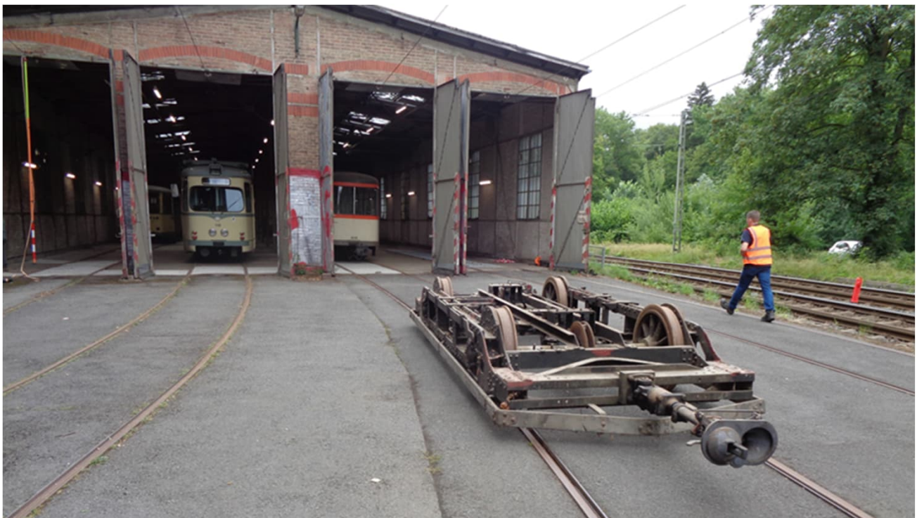
NIWH Süd-Ostfassade mit geöffneten Toren