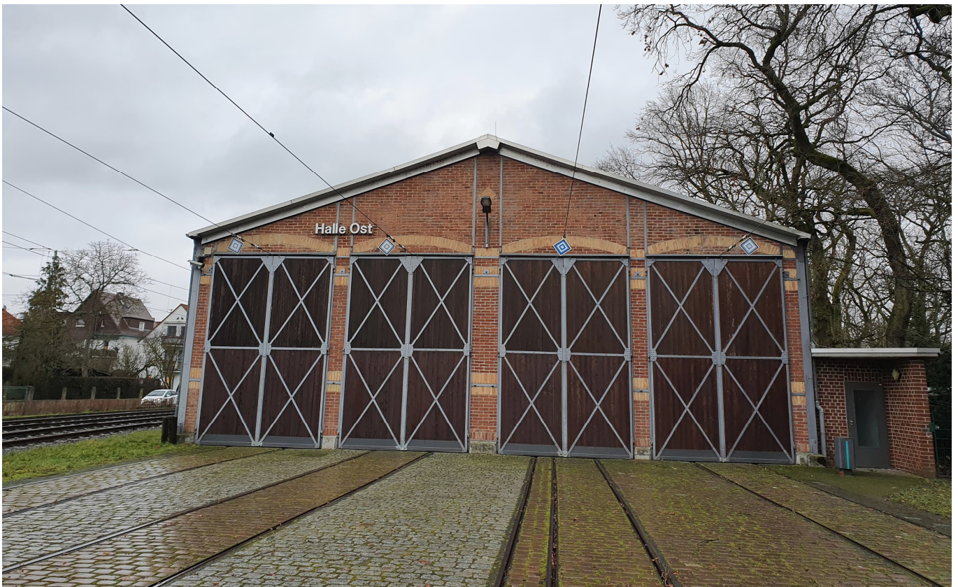
Das renovierte Pendant: Die Halle Ost beim Verkehrsmuseum Schwanheim