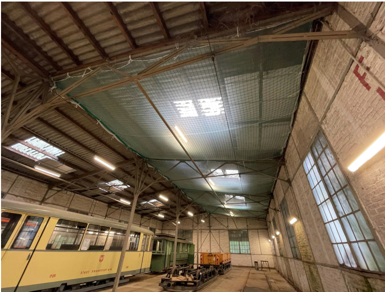
NIWH innen Blick auf Nordfassade + Blick auf Tore der Südfassade