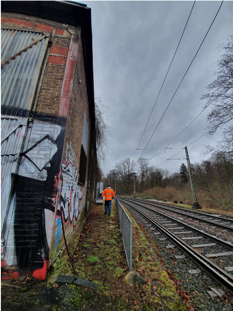
NIWH Süd-Ostfassade - Abstandsgeländer zum aktiven Gleis der Linie 17