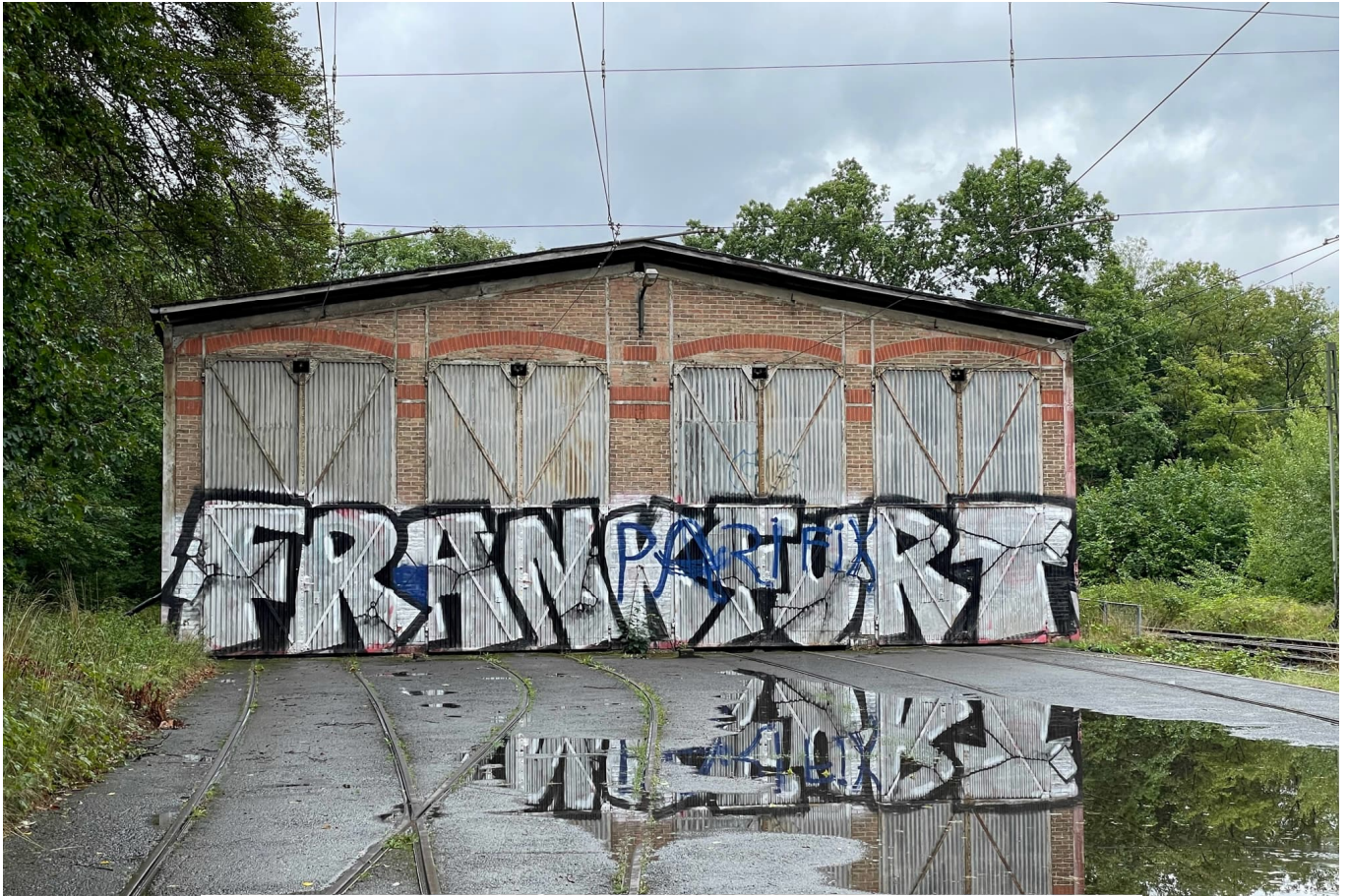
Südansicht der Wagenhalle Neu-Isenburg (NIWH)